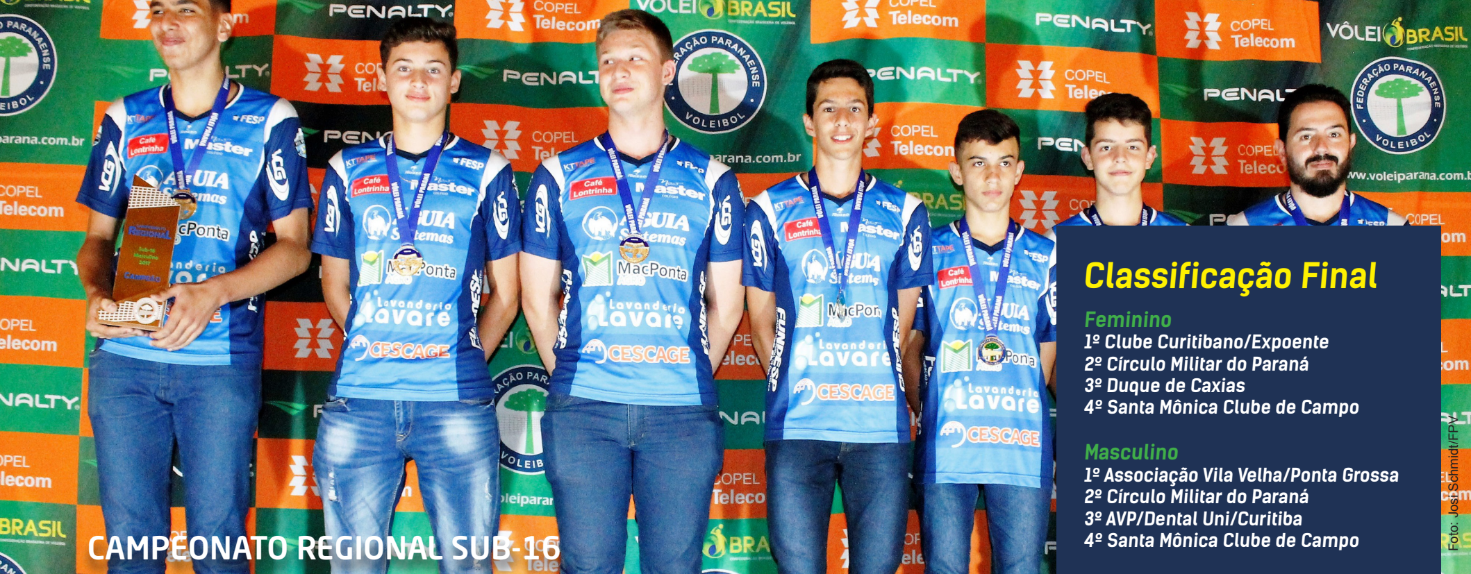
CAMPIONATO REGIONAL SUB-16